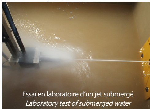
Essai en laboratoire d'un jet submergé Laboratory test of submerged water

The jet-grouting technique consist in elaborating a «concrete» by mixing in situ the soil with a cement grout.